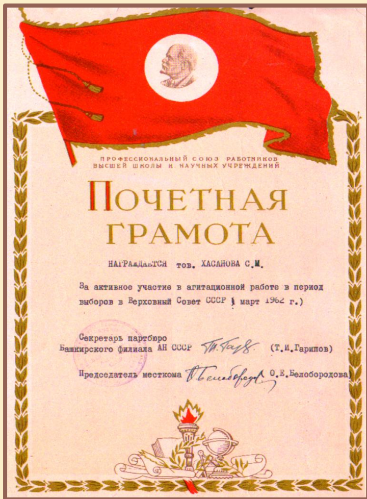
Почетная грамота партбюро Башкирского филиала Академии наук СССР. 1962 г.