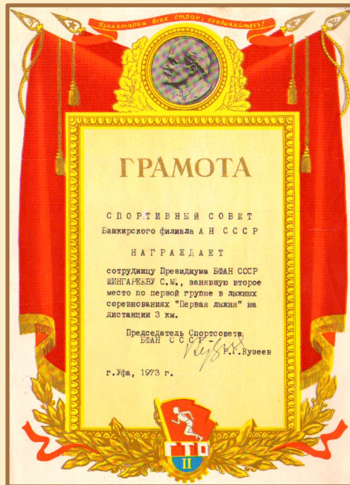
Почетная грамота Спортивного Совета Академии наук СССР. 1973 г.